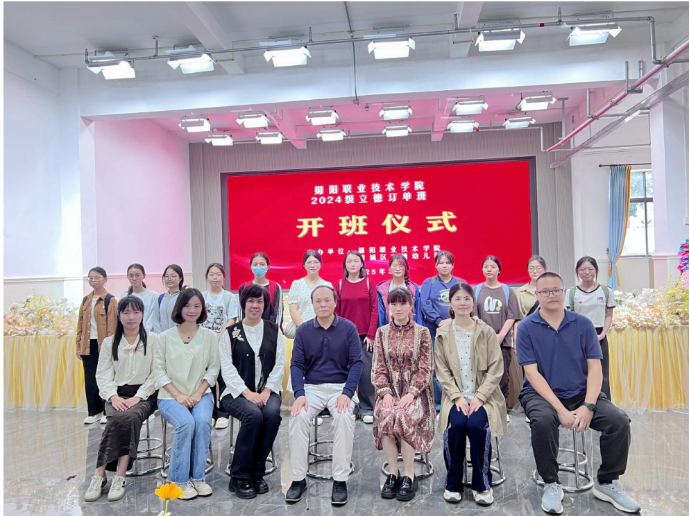
图 13 24 级立德订单班开班仪式