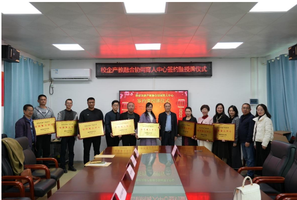
图 6 校企共建产教融合协调育人中心（第一批）授牌仪式