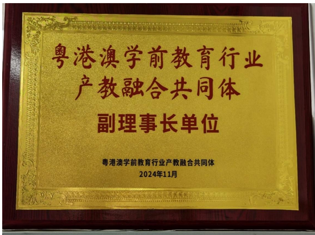
图2 粤港澳学前教育行业产教融合共同体（副理事长单位）