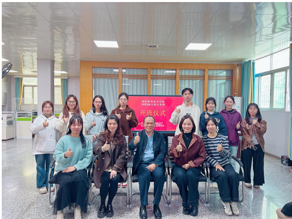
图 14 25 级立德订单班开班仪式