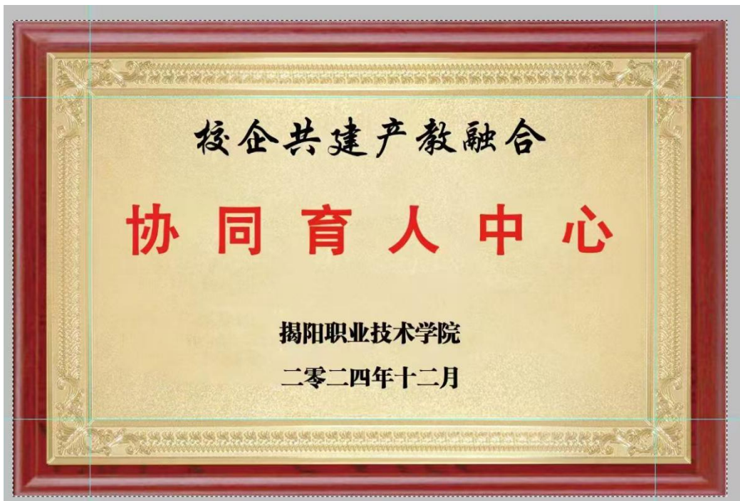
图 4 校企共建产教融合协同育人中心挂牌（2024.12）