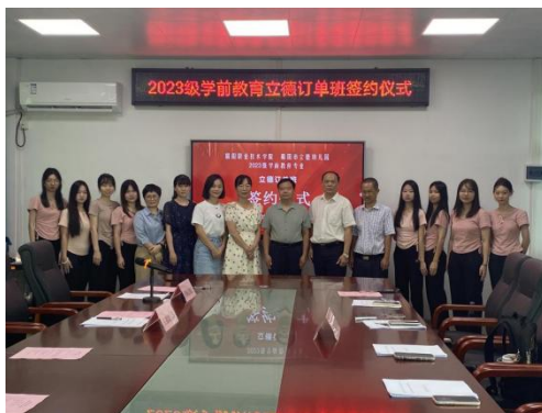
图9 23级立德订单班签约仪式