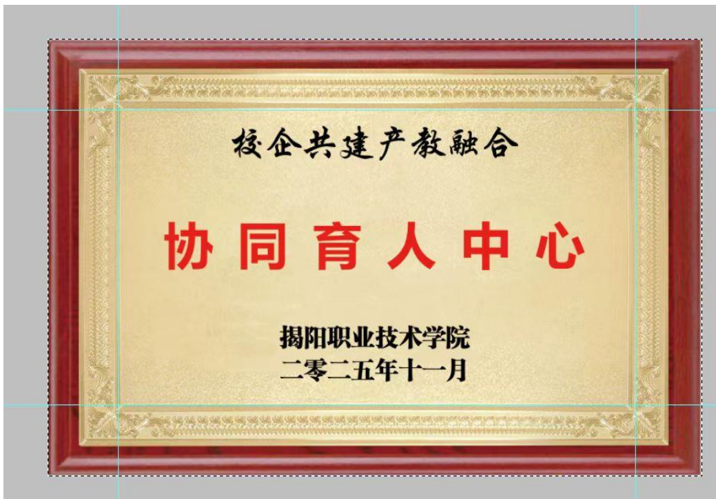
图 5 校企共建产教融合协同育人中心挂牌（2025.11）