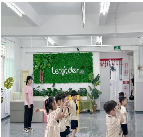
图12 23级立德订单班实践照片