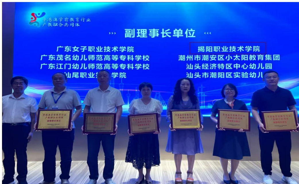
图1 粤港澳学前教育行业产教融合共同体授牌仪式