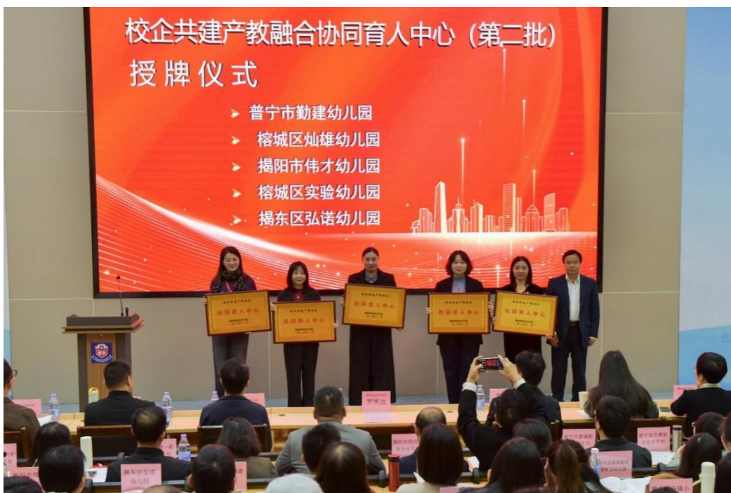
图 7 校企共建产教融合协调育人中心（第二批）授牌仪式