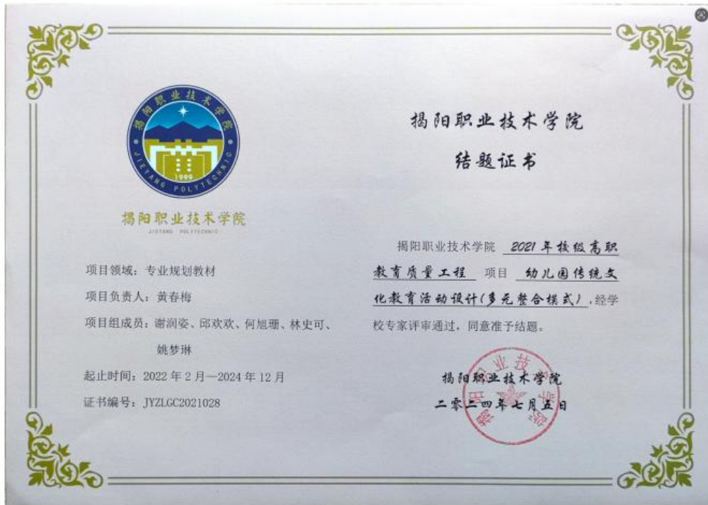
图 4 黄春梅老师主持《幼儿园传统文化教育活动设计(多元整合模式)》项目, 已结题