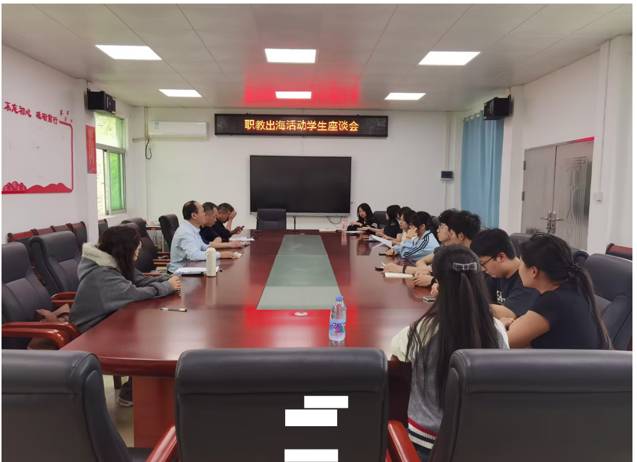
2026年3月20日专业群召开职教出海活动学生座谈会