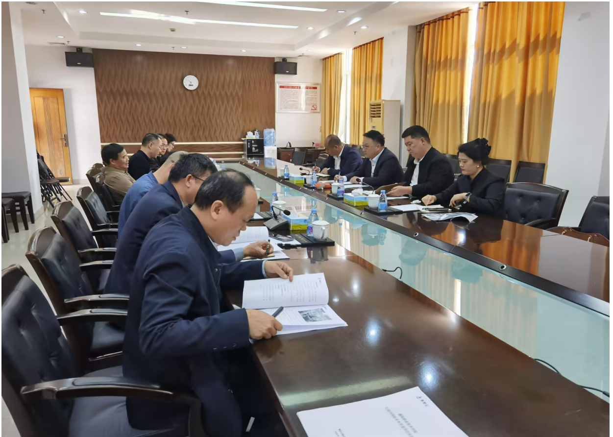
2026年3月16日学校召开马来西亚研学项目研讨会