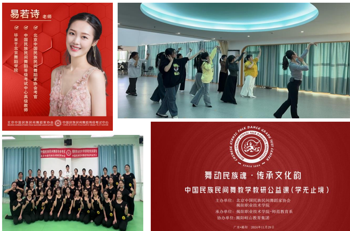
图6 与北京中国民族民间舞蹈家协会联合举办舞蹈教学教研公益课

依托学前教育发展联盟，共建协同育人中心与校外实训基地，覆盖见习、跟岗、顶岗全流程。聘请一线导师参与教学与竞赛评审，举办双选会，并与柚子教育等共建托幼一体化和舞蹈评级点，拓展特色育人通道。