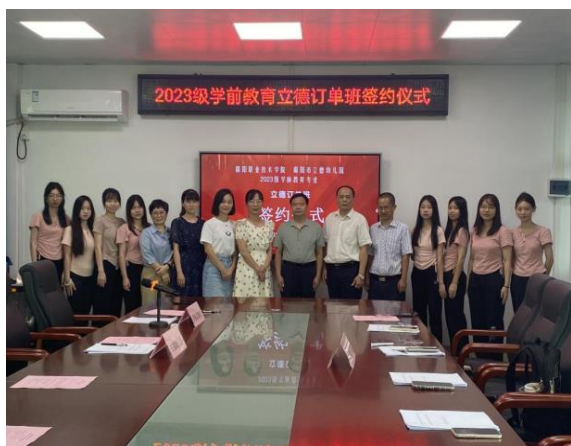
图3 学前教育专业与立德幼儿园签订订单班协议