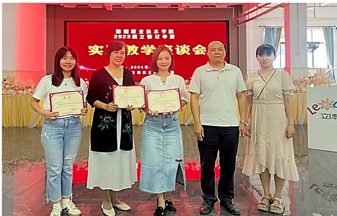
图 5 向幼儿园园长和指导老师颁发企业导师聘书