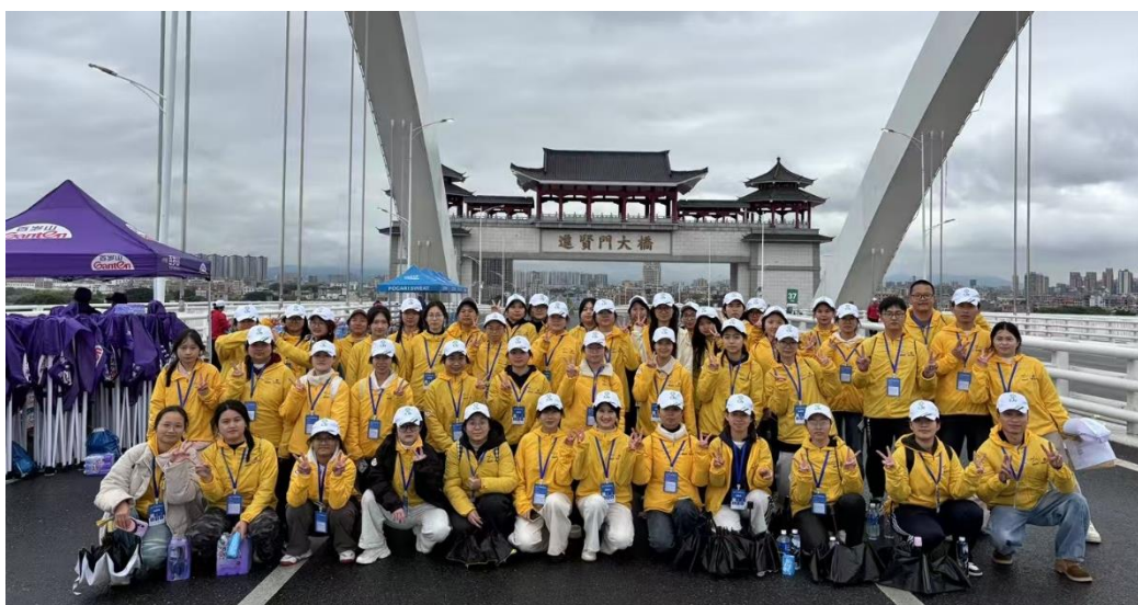
图 7 组织学生参与揭阳市全程马拉松赛事志愿服务