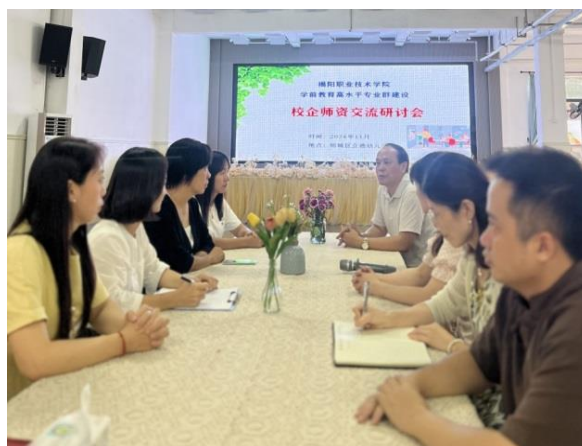
图4 与幼儿园开展交流研讨会