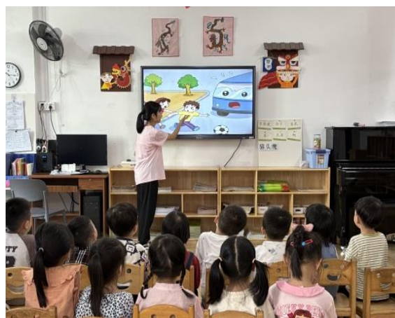
图5 学前教育专业订单班在幼儿园开展实践活动