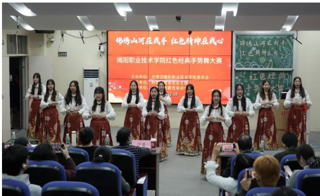
图 1 弘扬红色基因—专业群承办学校红色经典手势舞

党建融入育人全过程，落实党政联席会制度，确立“厚植幼教情怀、强化艺术素养、突出保教技能”的特色方向。推进课程思政建设，积极申报校级课程思政案例和省级课程思政示范课，实现专业核心课程思政全覆盖，并通过党员教师结对帮扶就业、红色手势舞大赛等活动，厚植师德修养。