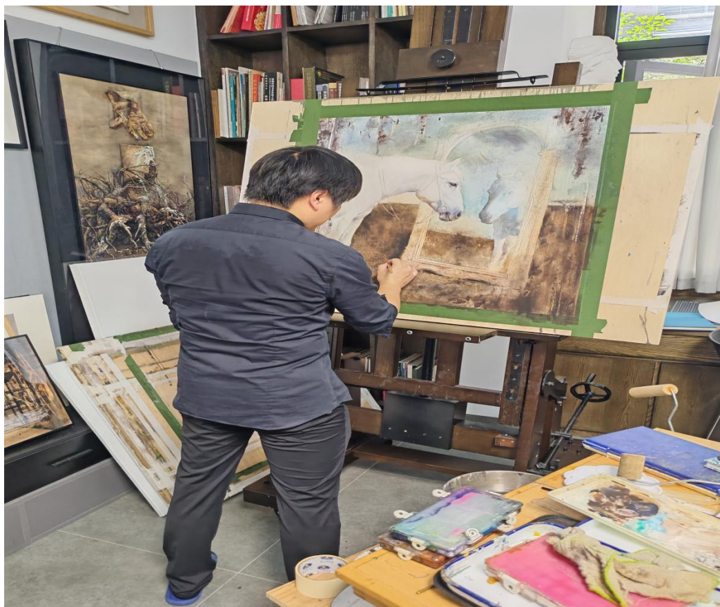
图 4 工作室教师进行创作教学