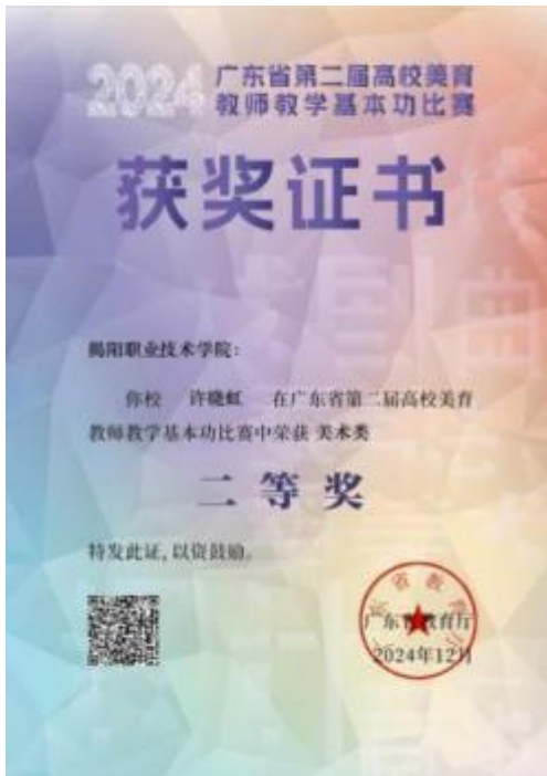
图 7 广东省第二届高校美育教师教学基本功比赛美术类