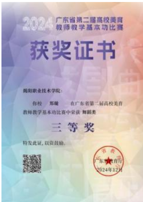
图 11 广东省第二届高校美育教师教学基本功比赛舞蹈类