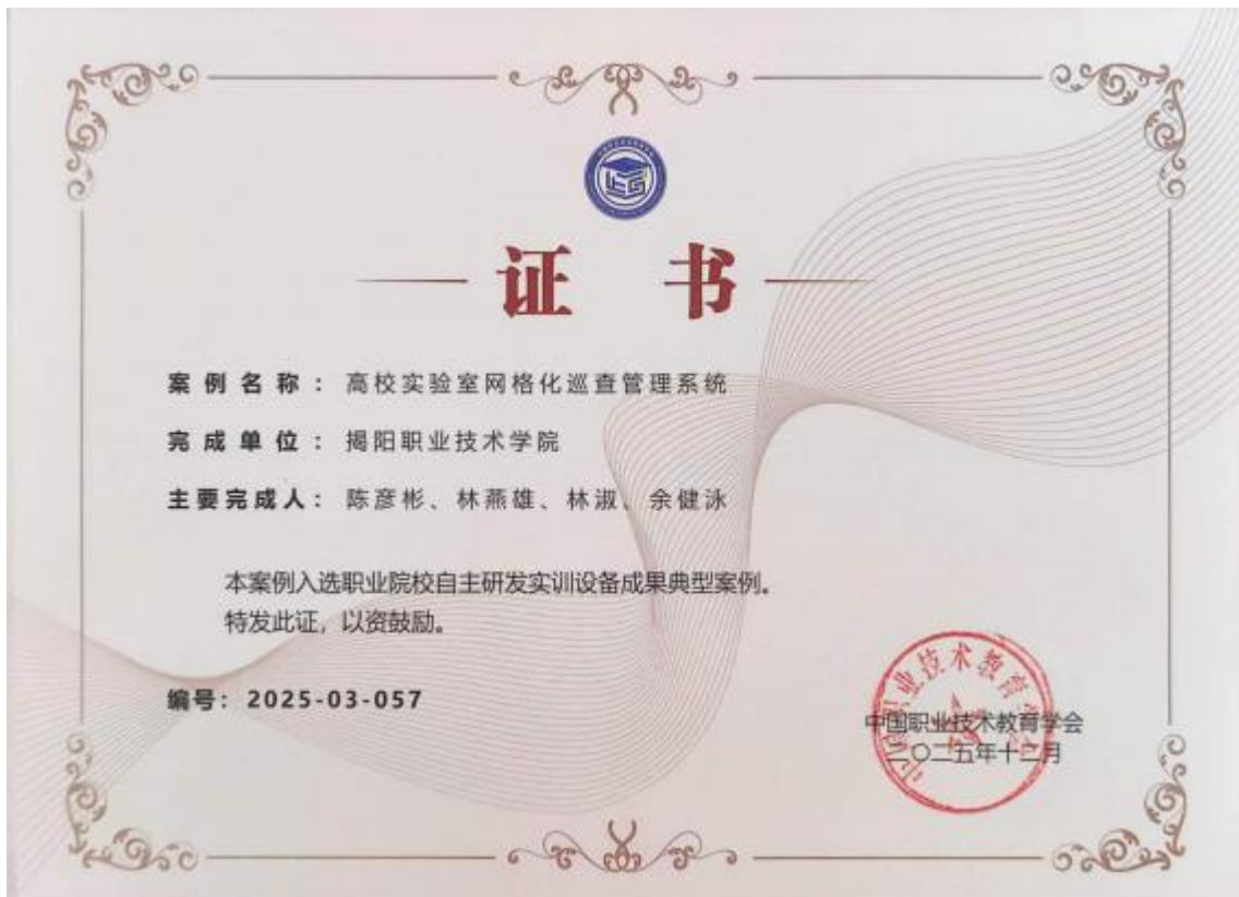
图 5 高校实验室网络化巡查管理系统