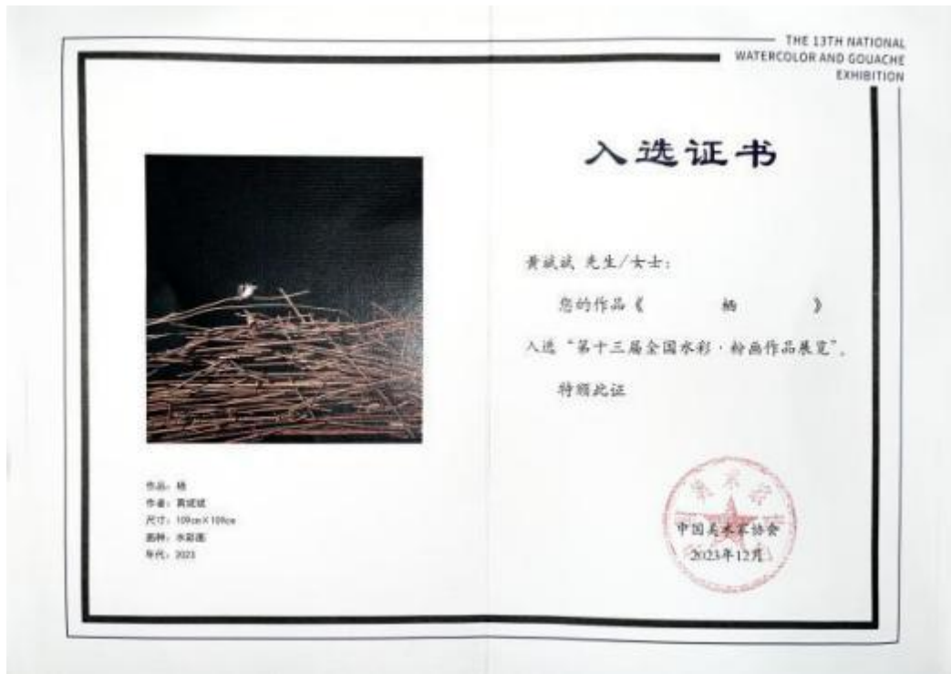
图 1 第十三届全国水彩·粉画作品展览《栖》