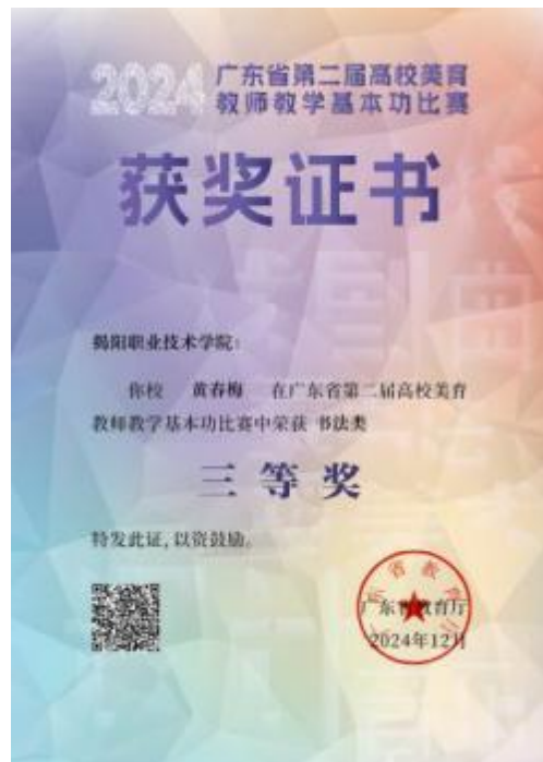
图 12 广东省第二届高校美育教师教学基本功比赛书法类