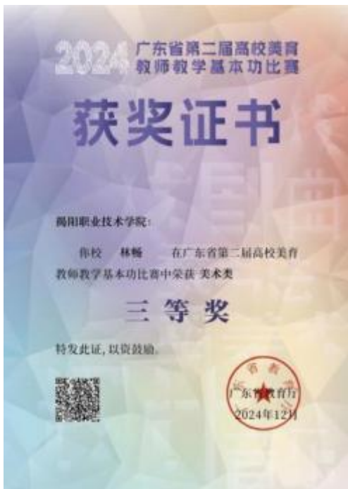
图 9 广东省第二届高校美育教师教学基本功比赛美术类