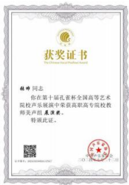
图 3 第十届孔雀杯全国高等艺术院校声乐展演高职高专院校教师美声组