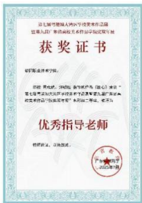
图 15 第七届粤港澳大湾区学校美术作品展暨第九届广东省高校美术作品学院奖双年展水彩组 《匠心》