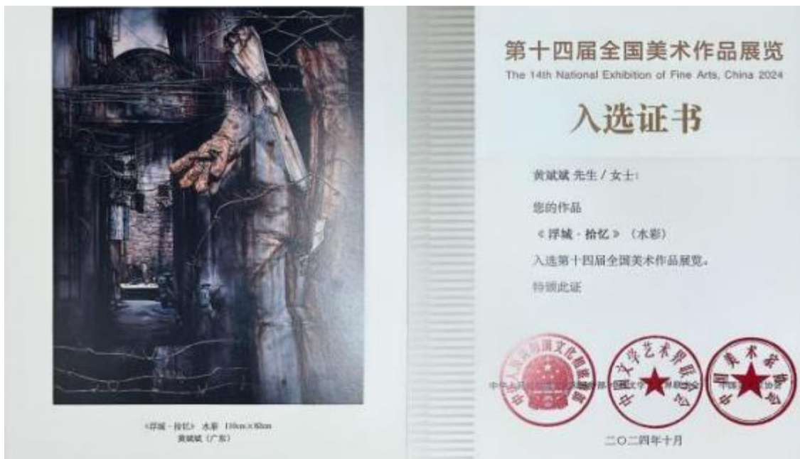
图 2 第十四届全国水彩·粉画作品展览《浮城*拾忆》