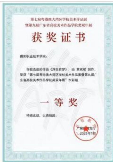
图 14 第七届粤港澳大湾区学校美术作品展暨第九届广东省高校美术作品学院奖双年展水彩组 《浮生若梦》