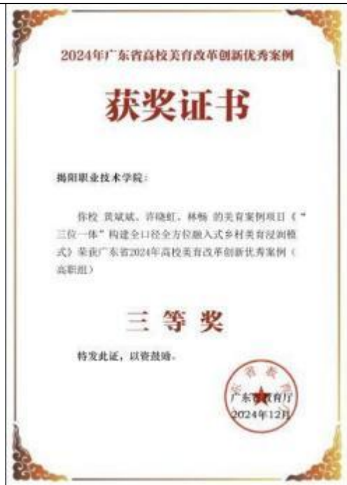
图 13 广东省高校美育改革创新优秀案例(高职组) 《“三位一体”构建全口径全方位融入式乡村美育浸润模式》