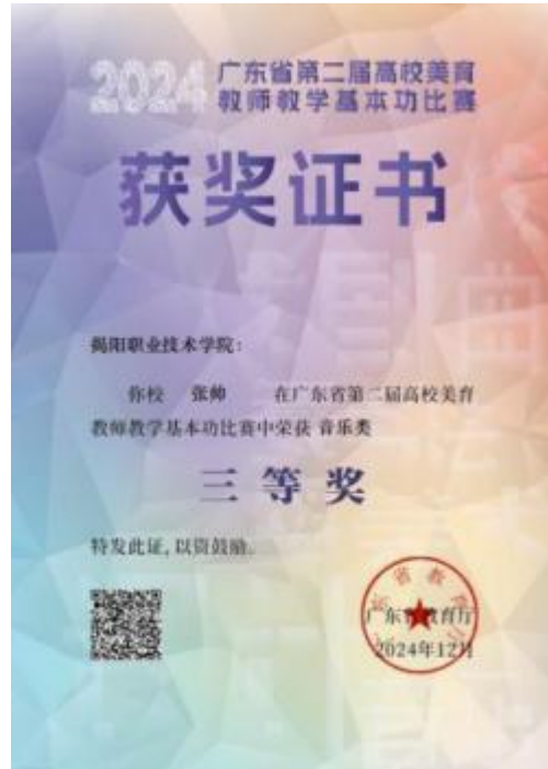
图 8 广东省第二届高校美育教师教学基本功比赛音乐类