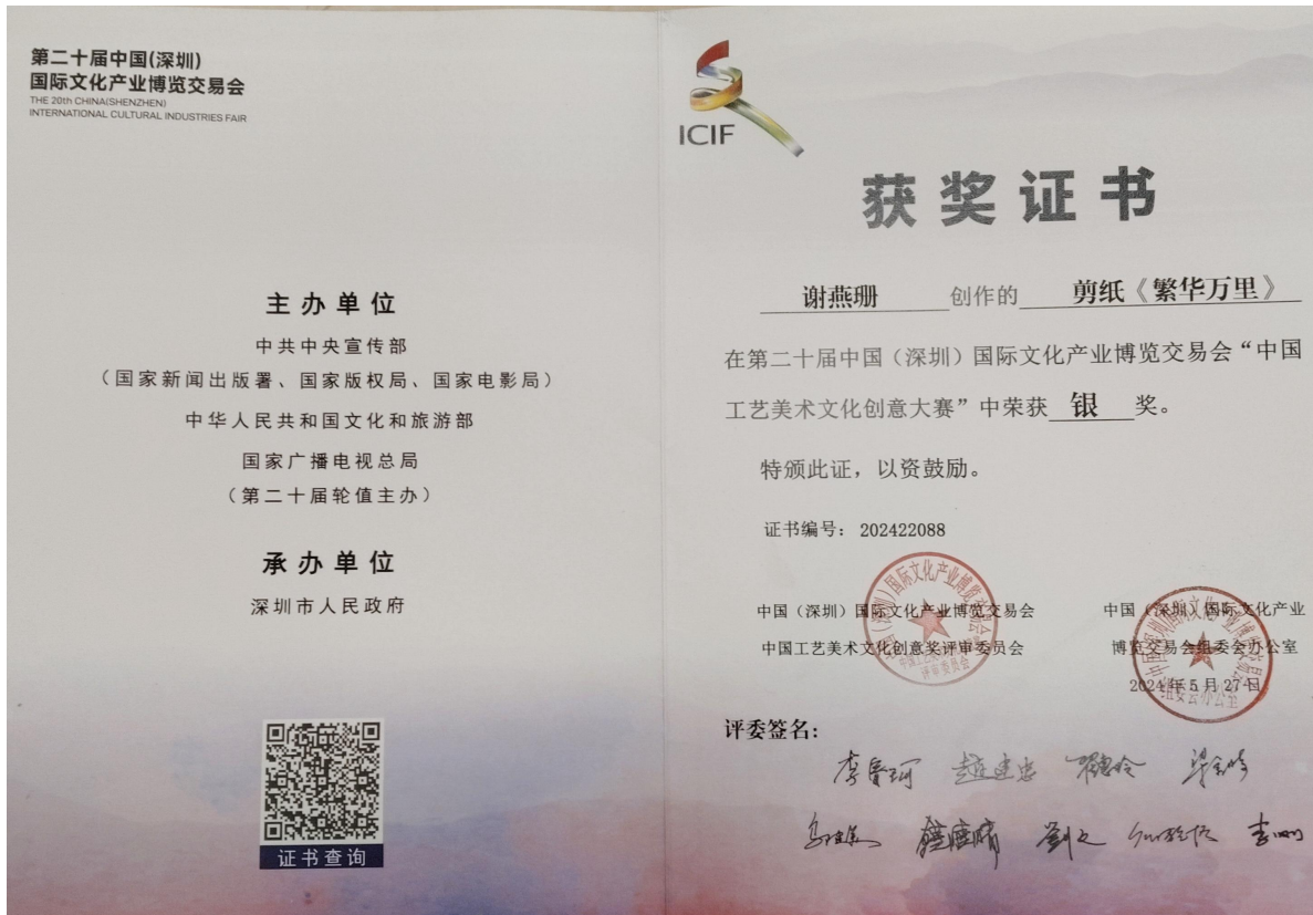
图6 第二届中国（深圳）国际文化产业博览交易会“中国工艺美术文化创意大赛”