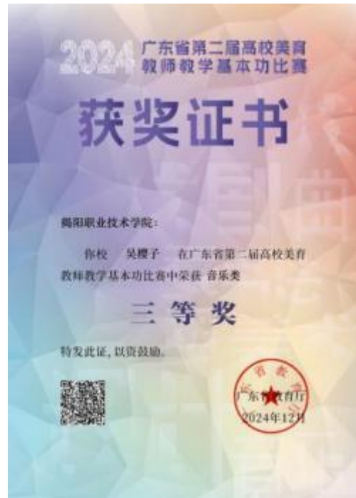
图 10 广东省第二届高校美育教师教学基本功比赛音乐类