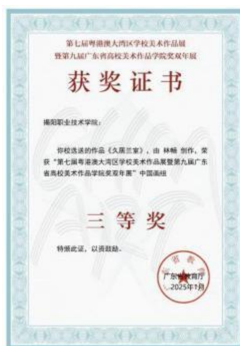
图 16 第七届粤港澳大湾区学校美术作品展暨第九届广东省高校美术作品学院奖双年展中国画组 《久居兰室》