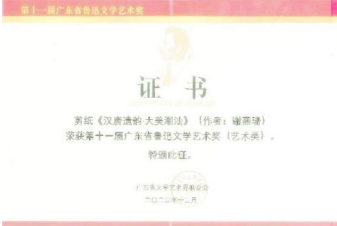
图 17 剪纸《汉唐遗韵-大美潮汕》获第十一届广东省鲁迅文学艺术奖