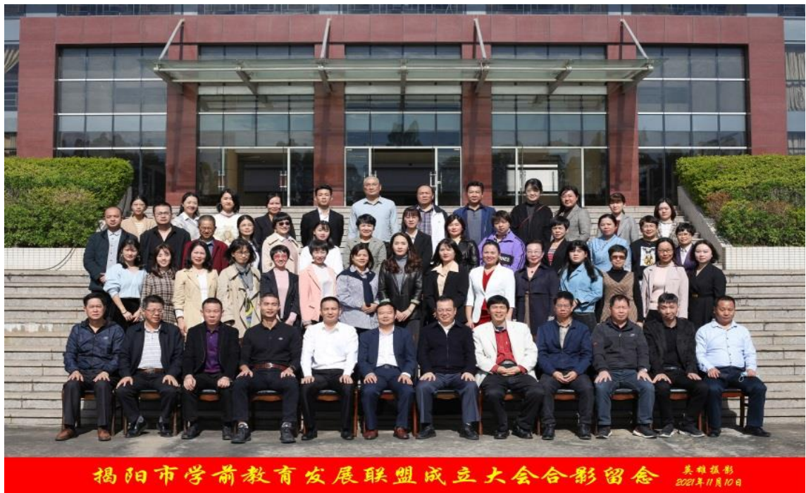
图1 2021年11月由揭阳职业技术学院牵头成立学前教育发展联盟

牵头成立市域学前教育发展联盟，截至2025年底加盟单位达43家，覆盖全市职业教育与幼教机构，扎实推进协同育人和推动市域学前教育发展。