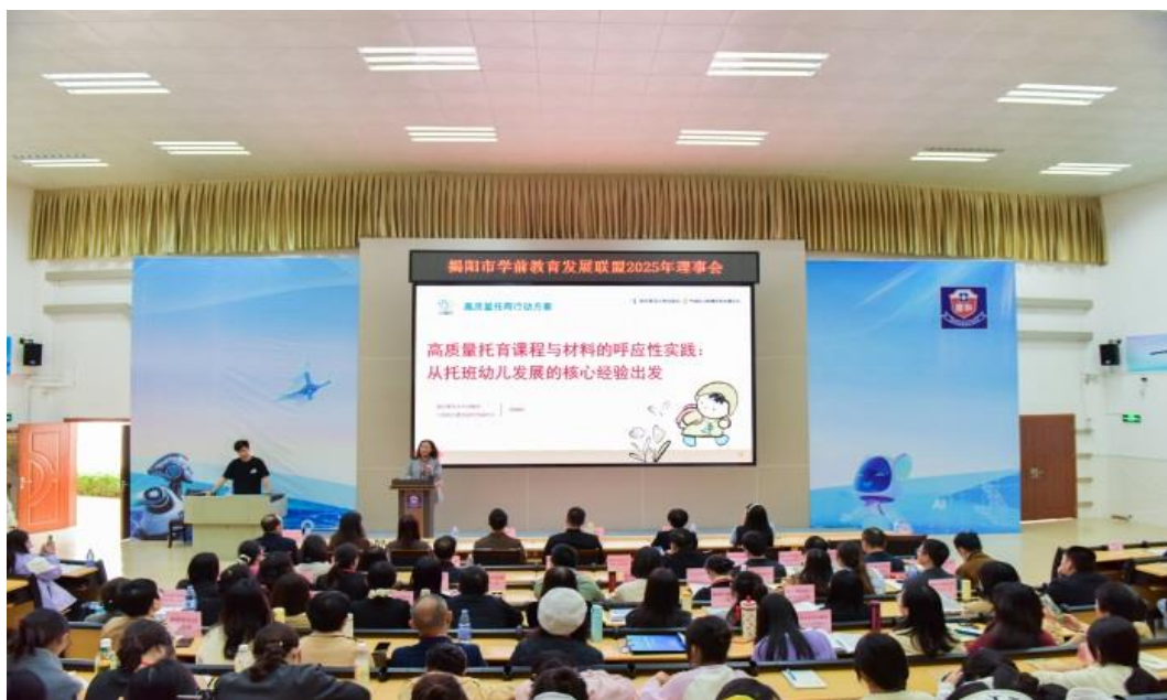
图3 联盟活动上专家开展专题讲座