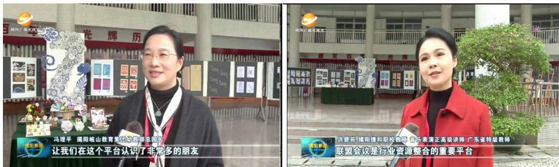
图5 联盟活动媒体报道