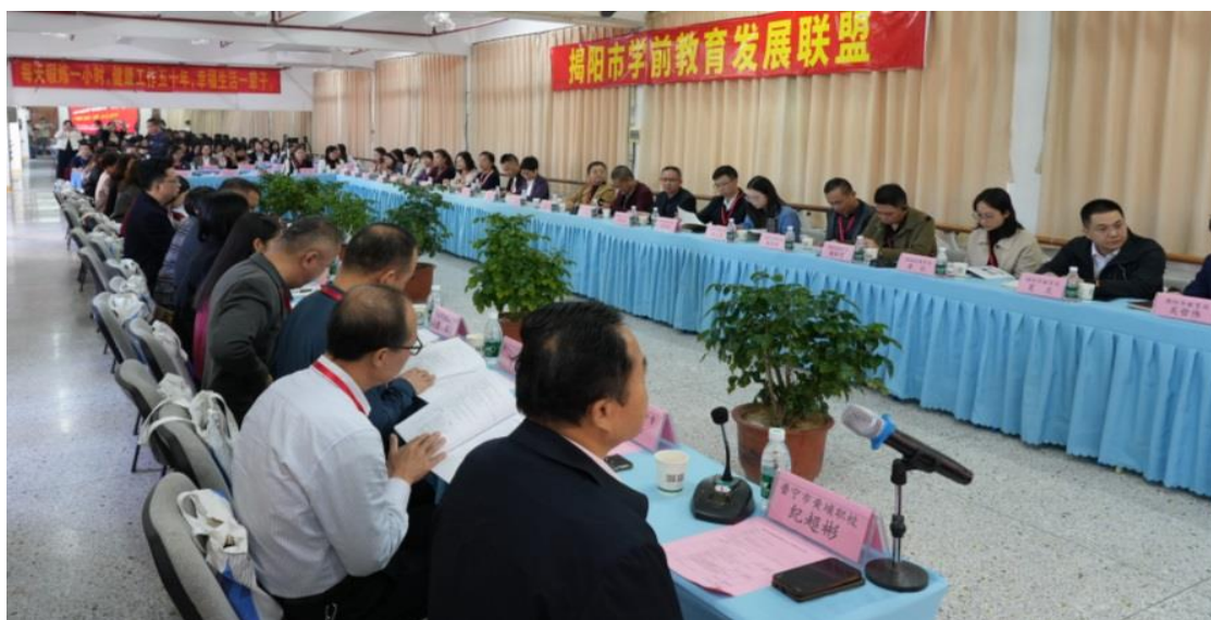
图2 2024年11月专业群召开联盟年度研讨会

一是推行“订单班+嵌入式”培养，与立德教育集团等用人单位共同制定人才培养方案、嵌入特色课程，邀请幼儿园一线骨干进课堂开展嵌入式教学。二是建立“师资互聘+协同教研”机制，选派专业教师赴联盟幼儿园实践锻炼，聘请幼儿园骨干教师担任兼职教师，联合编写《幼儿园实用手工》等校企双元教材。三是搭建供需对接平台，举办产教融合双选会，与成员单位共建校外教育实习基地。四是实施“三二分段”合作办学，打通中职到高职升学通道；联合普宁市教育局组织教学团队，为乡镇中小学、幼儿园教师提供美术、音乐、书法等专场培训。