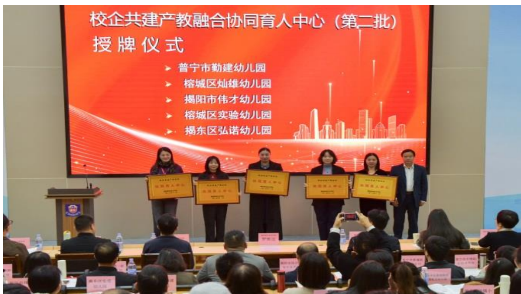
图4 2025年11月召开联盟年度研讨会上，向成员单位签订产教融合协同育人中心并授牌