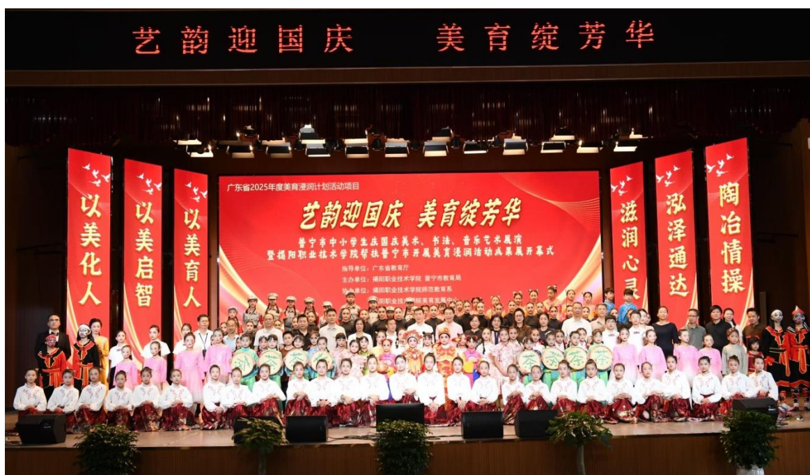
图10 2025年9月，美育发展中心指导普宁市教育局开展“艺韵迎国庆- 美育绽芳华”中小學生艺术展演