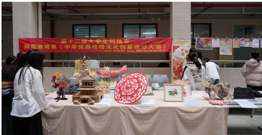
图2 专业群举办中华优秀传统文化创意设计大赛