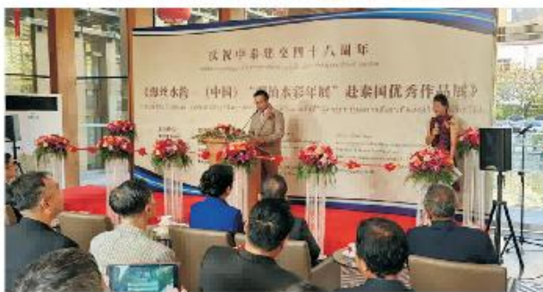
泰国文化部副部长鹏蓬致辞