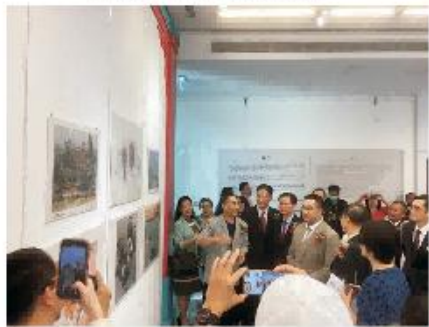
泰国文化部副部长鹏蓬观看展览